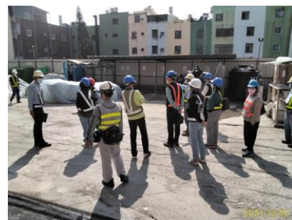
東港舊榮工之家立體停車場統包工程(T109T31033)