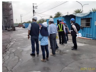
屏東縣多層級樂活照顧服務設施園區新建工程(T110T11007)