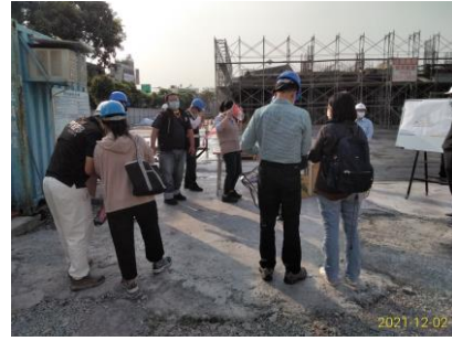
潮州聯合辦公大樓興建工程(T109T21030)