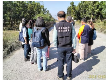
110 年力力溪大橋上游斷面力 12 至力 17 河段疏濬工程(T110TGZ038、T110TGB006)