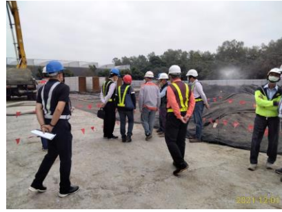
農科園區客製化國際保鮮物流中心第一期廠房新建工程(T109T62012)