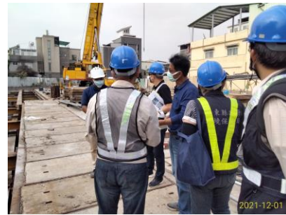
北基國際股份有限公司等 74 戶集合住宅新建工程(T109T11103)