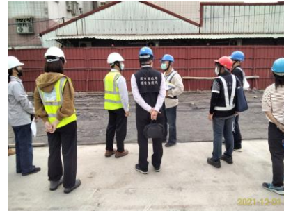
屏東縣政府職務宿舍新建工程(T110T11003)